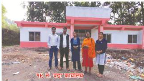
१४ नं. वडा कार्यालय