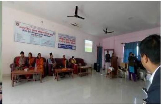
मानव अधिकार दिवस तथा १६ दिने अभियानको