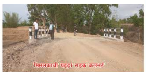
सिमलकाची पट्टा सडक कलभर्ट