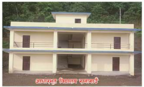
आधारभूत विद्यालय रावामाई