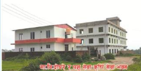
सावित्रीधर र पशु सेवा कृषि सेवा भवन