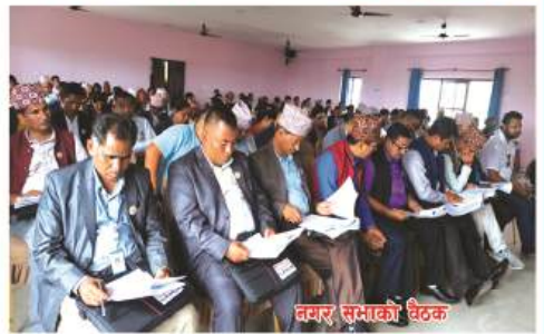
वगर सभाको बैठक