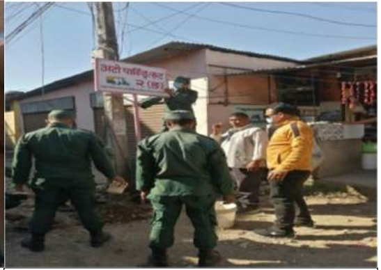
फिल्ड अभियान कार्यक्रम राखी उद्योग व्यापार व्यवसाय दर्ता नविरकण गर्दै हामी