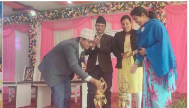
संसदिय अभ्यासमा महिलाको नमूना संसद बैठकमा नगर प्रमुखज्यूबाट कार्यक्रम उदघाटन