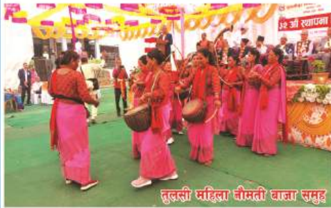
तुलसी महिला नौमती बाजा समुह