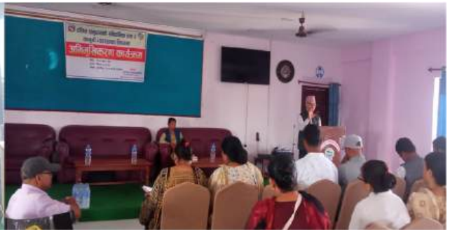
दलित समुदायका हक र अधिकारका विषयमा माननिय मुख्य न्यायाधिस नित्यानन्द पाण्डे