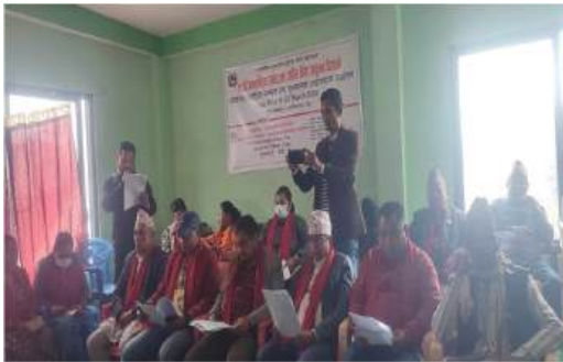
जातिय छुवाछुत विरुद्धको दिवस