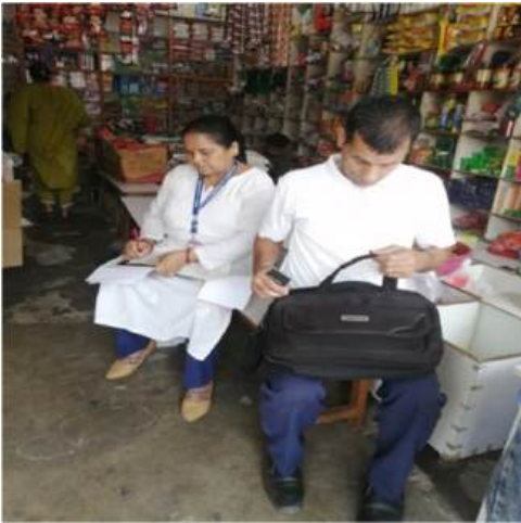
अटो पार्किङ बोर्ड राख्दै बजार व्यवस्थापन उप समिति टिम