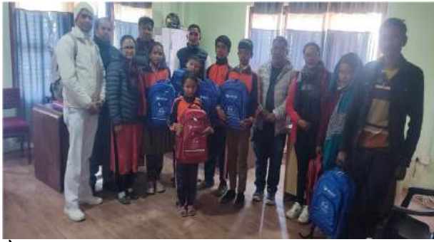
लैङ्गिक हिंसा विरुद्धको १६ दिने अभियानको सन्दर्भमा समिक्षा सहित समापन वेस संस्थाद्वारा बालबालिकालाई सहयोग