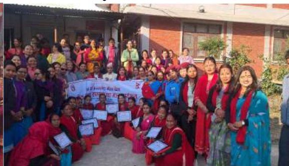
अन्तराष्ट्रिय महिला दिवस