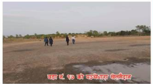
वडा नं. १७ को फुटबल खेलमैदान