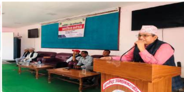
जनप्रतिनिधिज्यूहरु र ज्येष्ठ नागरिकहरुका विचमा अन्तरकृया कार्यक्रम