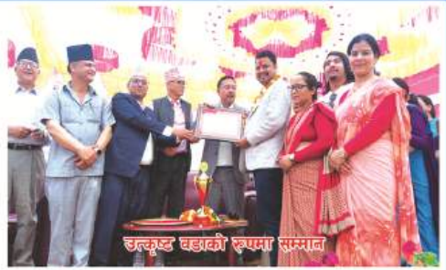
उत्कृष्ट वडाको रुपमा सम्मान