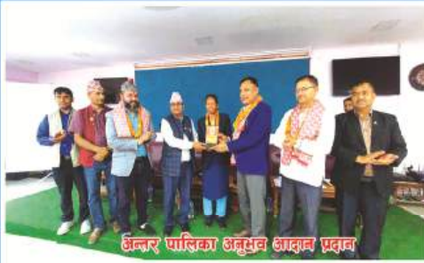
अन्नर पालिका अनुभव आदान प्रदान