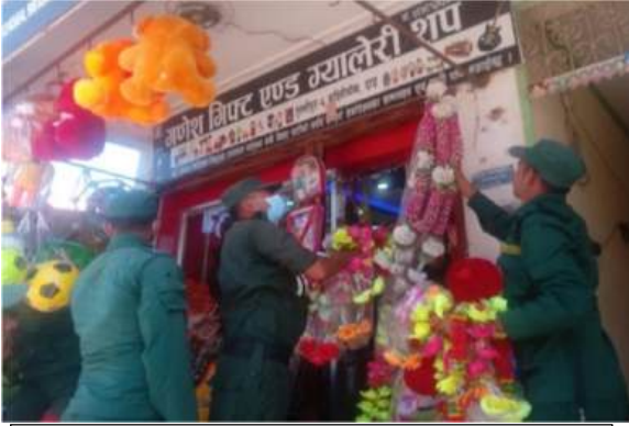
प्लाष्टिक जन्य फुल मालाहरु बेचन रोक लाएपछि जफत गर्दै बजार व्यवस्थापकहरु