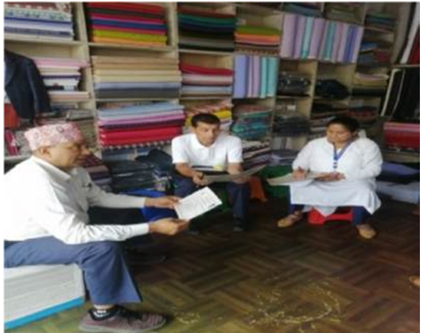
खाद्य स्वच्छता सम्बन्धि सामुदायिक विद्यालय वडा नं १४ भोजपुरमा केहि कुरा राख्दै उपप्रमुखज्यू